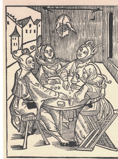
Il vizio del giuoco, quarta Parte, prende tutti, giovani e vecchi, nobili e villani, clero e laici, perfino le donne. Quando hanno davanti dadi e bicchieri, per loro tutto il mondo è teatro, diti al gioco tutti i beni dell'anima e del corpo si corrompono, tutti i vizi si alimentano (dal. 80).

S. Brandt - Il vizio del giuoco (Nave dei folli, 1494)