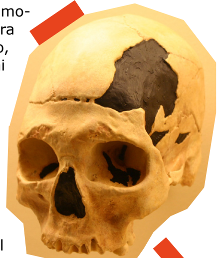
Teschio ritrovato in Romania, nella grotta di Peștera cu Oase.

È possibile che sia avvenuta anche un' ibridazione con l' Homo di Denisova , i cui tratti però sono stati ad oggi trovati solo nel DNA degli abitanti delle isole orientali di Indonesia, Nuova Guinea e Australia.