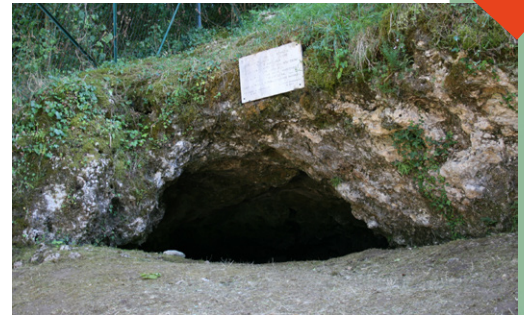
La Chapelle-aux-Saints , in Francia, dove nel 1908 è stato rinvenuto lo scheletro di un Homo neanderthalensis anziano, risalente a 50 000 anni fa.

Il DNA si conserva in particolare in climi freddi, e non è stato quindi possibile uno studio diretto nel caso di un'altra scoperta recente, l' Homo floresiensis , i cui resti sono stati trovati nell'isola indonesiana di Flores e che presentano caratteri molto diversi da noi.